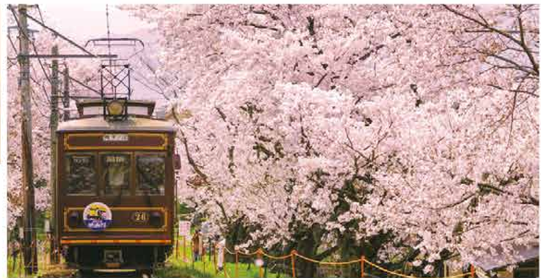
嵐電 桜のトンネル 鴨津～宇多野駅間の約200mにわたる桜のトンネル。レトロな車両が旅気分を盛り上げてくれる。花の見頃は、ライトアップされた夜桜を車窓から眺める「夜桜電車」も運行。