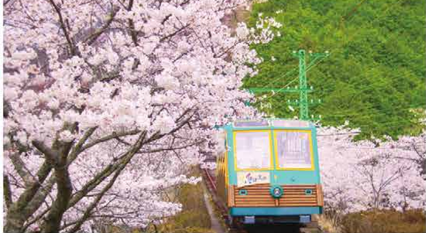
妙見の森ケーブル・リフト 桜並木と同じ目線で花見ができる。春の暖気に誘われ、桜と里山を満喫。

fulari cafe 上)4月15日までの「春色さくらソフト」450円は、花びら型のイチゴとバスマルカラーの「おいり」がキヌートミルキーなソフトクリームに、イチゴソースと桜あんがベストマッチ。 左)春色ケーキ。カラに似たお店は思わず足を止めてしまう可愛さ。