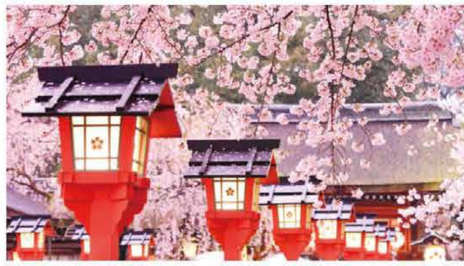
平野神社 平安時代から都を代表する花見の名所。早咲きから遅咲きまで様々な品種があり、見頃は長く観くのも魅力。