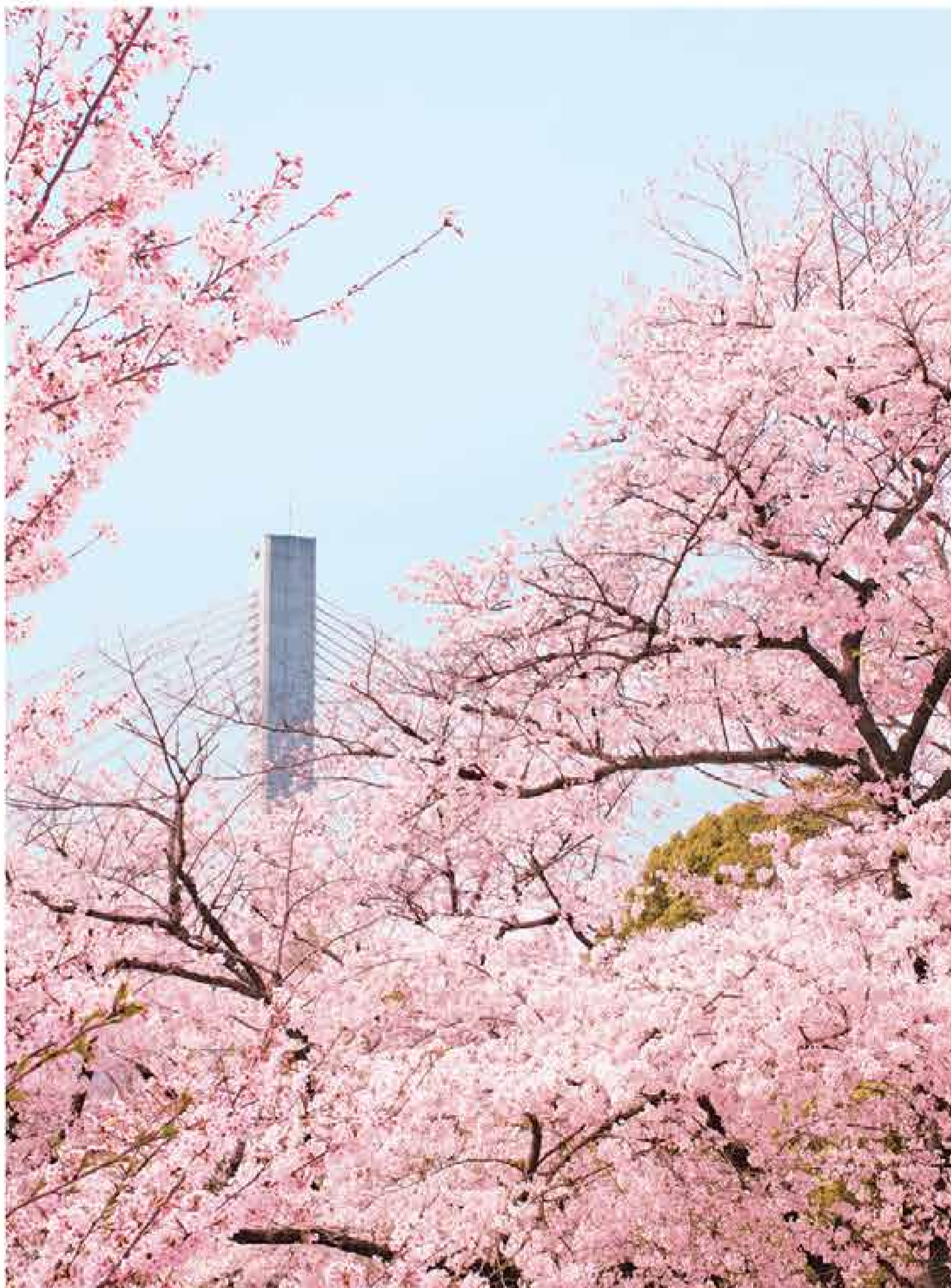
五月山緑地 入り口から山頂まで、至るところにソメイヨシノやヤマザクラが咲き誇る。大阪府下屈指のお花見スポット。満開の頃は提灯(ちょうちん)が灯(とも)る夜の桜も情緒たっぷり。

Café de 佛蘭西 左)ふわっと軽い食感の自家製シフォンケーキは、全部で6種。ドリンクとセットで1,000円〜。 右)閑静な住宅街の一角。神戸の街や王子公園の桜と風景車を眺めながら食事やお茶ができる客室の常は人気が高いので、前予約がベター。