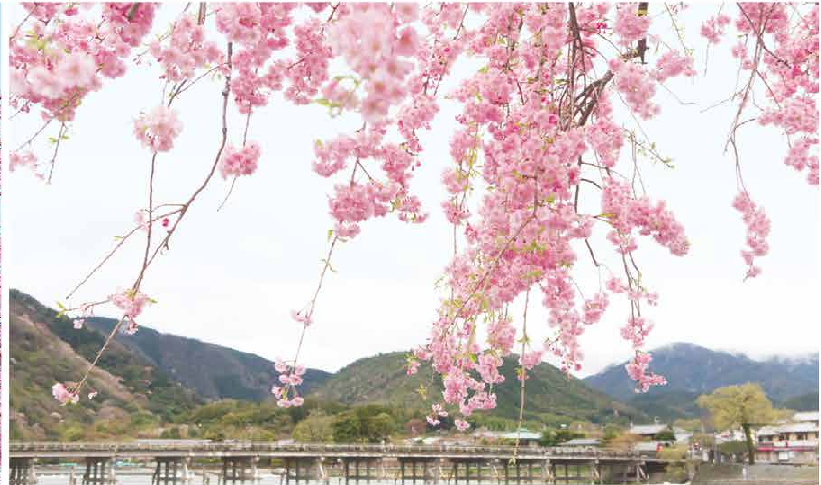
嵐山渡月橋 雄大な西山連峰を背景とし、満開の桜越しに見渡す渡月橋の美しさは、まさに嵐山を代表する景観。まだらに山肌を染める桜や、兩岸に続くピンクの帯を眺めながらそぞろ歩きを楽しもう。