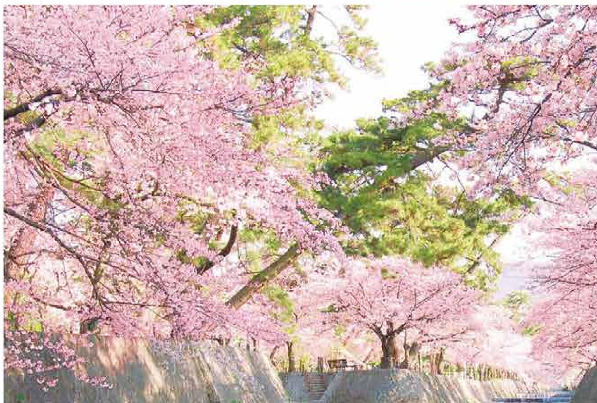
鳳川公園一帯 鳳川の両岸からせり出すような桜の枝と、川面に映る桜。上下に広がる桜景色は、川を渡る飛び石から楽しむことができる。川面近くと、土手の上からでは、同じ桜の木が異なる表情を見せてくれるのも面白い。