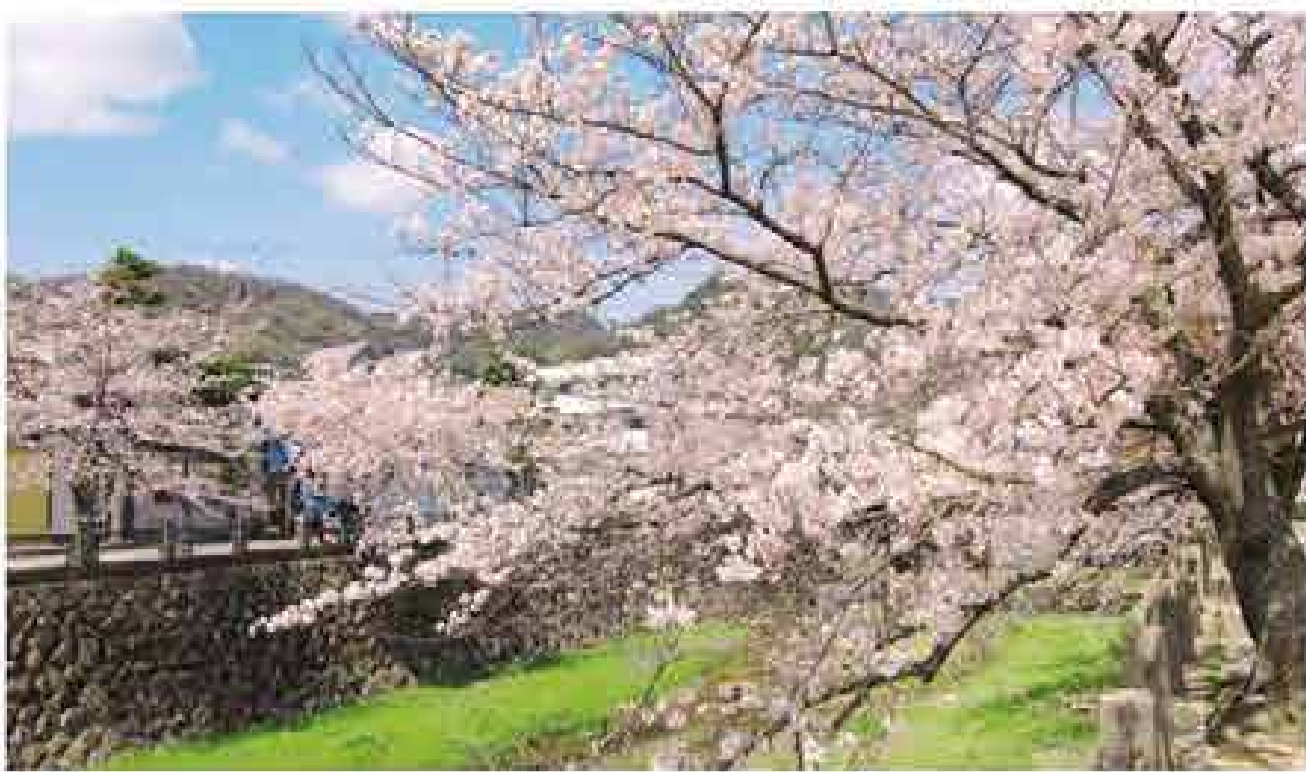
芦屋川 河川敷でシートを広げて花見を楽しむグループが多い、阪急芦屋川駅付近。4月7・8日にはさくらまつりが開催され、多くの人でにぎわう。