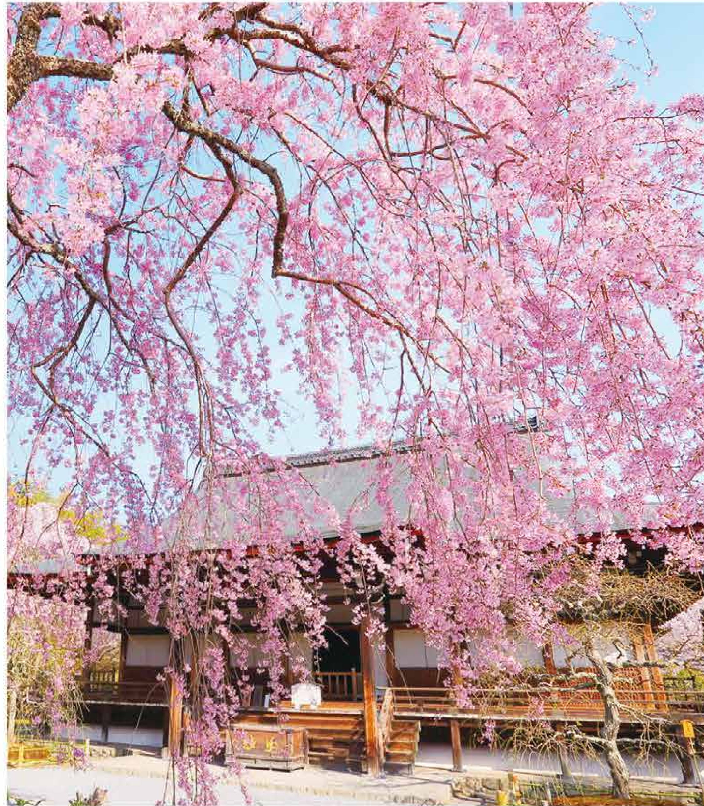
天龍寺 境内の至るところで桜が見られる天龍寺。ペニンシラクラが美しい多宝殿周辺は特に人気。