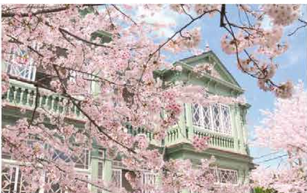
王子公園・王子動物園 神戸・北野から、1963年に移築された旧ハンター住宅(重要文化財)。4・5月に限定公開される邸内からの桜の眺めも格別。