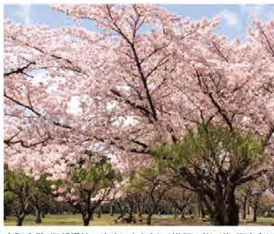
大阪府営 服部緑地 青空によく映える満開の桜の花。園内各所にある桜スポットをのんびり巡るのがおすすめ。