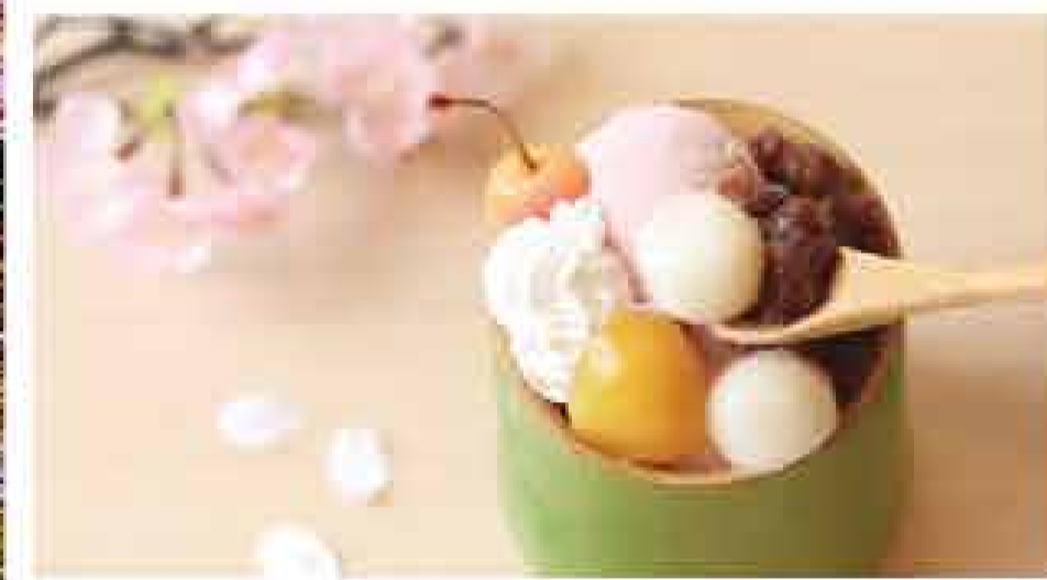
嵐山さくら餅屋 (上) 夜露のパウダーを添えた淡いピンク色のアイス。もちもちとさららかな白玉、煎あんなど、パフェのような組み合わせの「さくらアイス」700円。(左) 天龍寺を背景に飾る2階の特等席でひと休み。