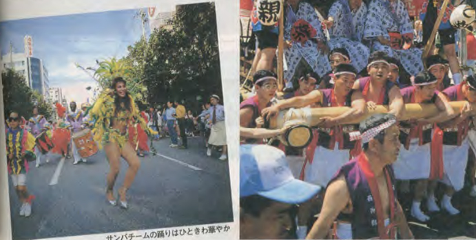
サンパチームの踊りはひとときわ華やか