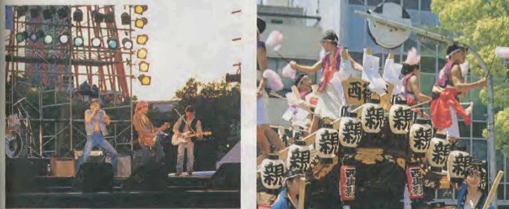
コンサートも催される

昨年が震災で中止になったが、今年は居留地返還記念日にあたる17日から、「海の日」として国民の祝日になった20日と翌21日を中心に開催。メイン会場はハーバーランド、メリケンパーク、東遊園地の三カ所。