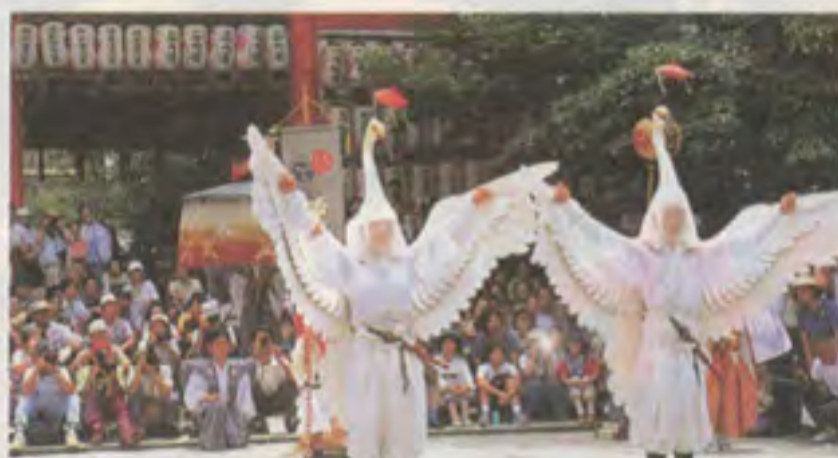
花傘巡行後の囃舞(八坂神社)