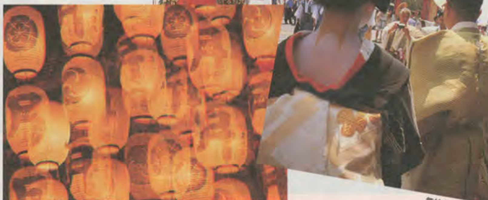
宵山の幻想的な提灯はムード満点