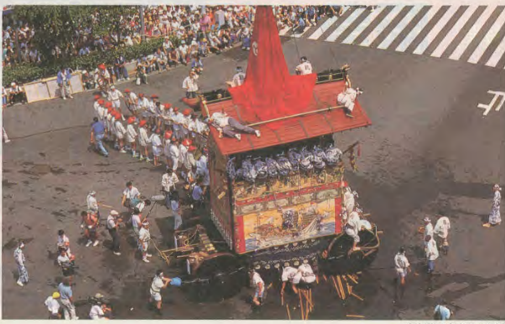
山鉾巡行の辻廻しは大きな見物