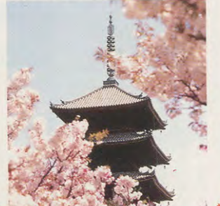
●大原野神社・花の寺 京都線 東向日駅から阪急バス南春日町下車 ●みのお瀧安寺 宝塚線 箕面駅下車