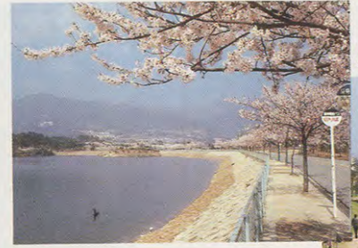
●北山ダム 神戸線 甲陽園駅または仁川駅下車

花さそふ 比良の山風ふきにけり こぎ行く舟の跡見ゆるまで 宮内卿 上流階級が花見を楽しむようにな ったのは平安時代になってから。 川に船を浮かべ、歌会を催す。水面 に浮かぶ花びらを題材に歌を詠む 桜は、王朝絵巻をひもとくよう な宴の様子を、今もうかがわせてく れる。