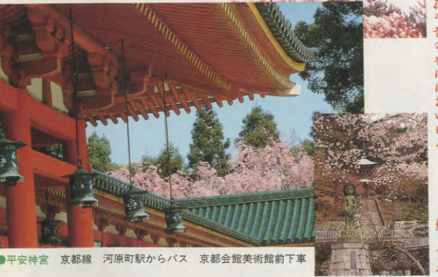
●平安神宮 京都線 河原町駅からバス 京都会館美術館前下車