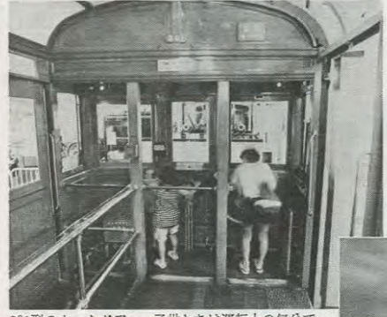
301型のカットボディ。子供たちは運転士の気分です。

別のコーナーでは、木造車から全金属車の移り変わりをカットボディで展示。最新車両への構造の違いが一目でわかる。これらの車両には、実際に機器に触れたり、乗り込んで運転士気分にしてもらえるものも含まれている。