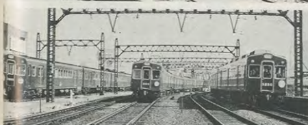
現在の3複線左から2000型、3000型、5000型