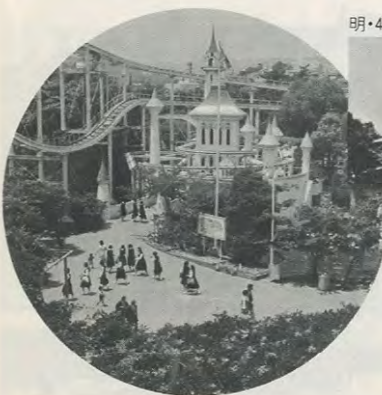
現在のファミリーランド園内