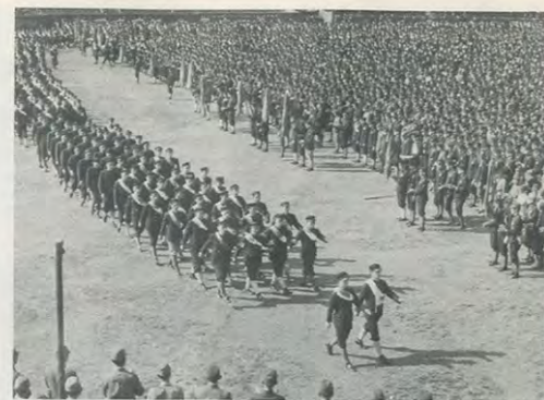
昭・8 学徒動員で多くの学生が戦場へ