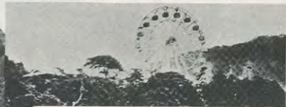
明・44 箕面動物園内の観覧車