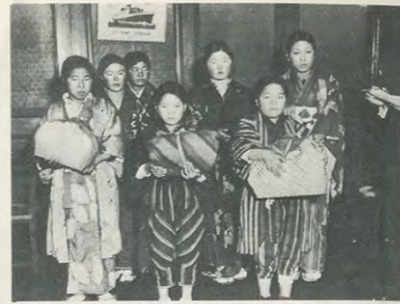
昭・9 東北凶作の出稼ぎ女子6県で6万人