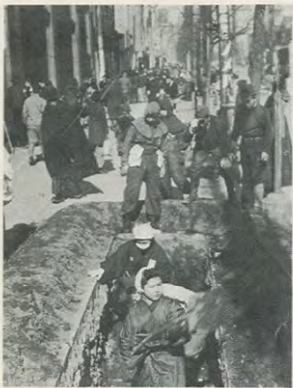
昭・17 歩道にも防空壕