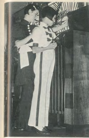
でもカッコイイ3年頃のモダンガール