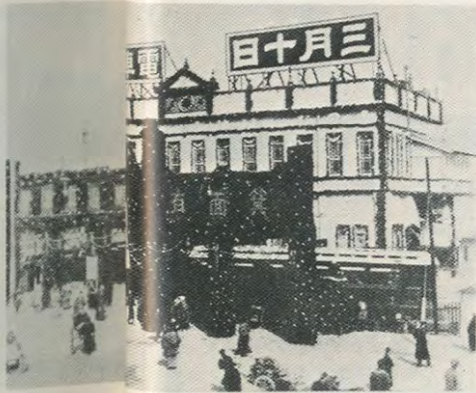
明・43 開通当時の梅田駅