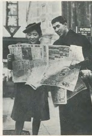
16年12月8日その日の街の顔