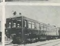
昭・2 日本初の大型車両P6型