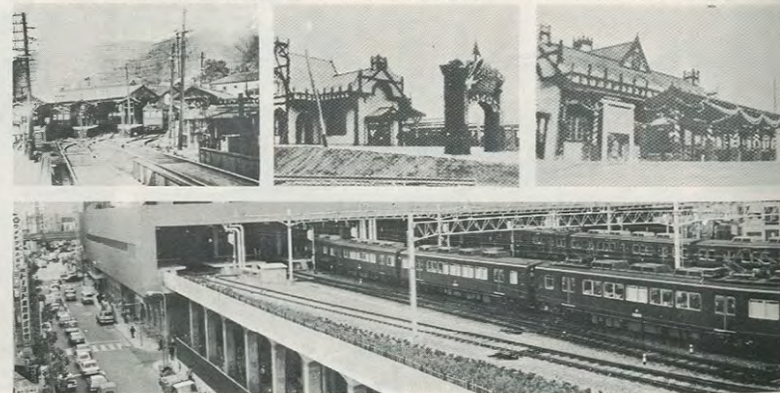
現在の梅田駅。地下は、川が流れる阪急三番街。