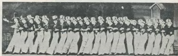
昭・2 日本初のレビュー「モン・パリ」