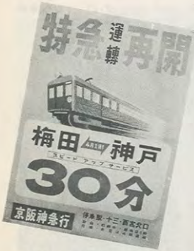
昭・24 戦前より5分遅くなった特急